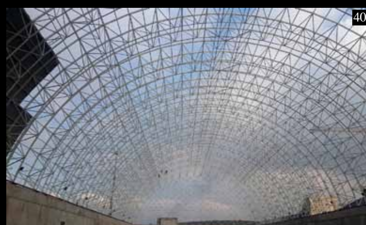
25. Управленческое Здание – Абу-Даби - О.А.Э. 26. Меж. Аэропорт TAV Терминал 2 – Анталья - Турция. 27. Международная Школа “Орикс” – Доха - Катар. 28. Парк Отдыха –Доха - Катар. 29. Цементный Завод ‘Батысоке’ – Айдын - Турция. 30. Цементный Завод “Чимса” – Афьон - Турция. 31. Здание Банка – Маскат Оман. 32. Теннисный Корт Саламанка – Испания.