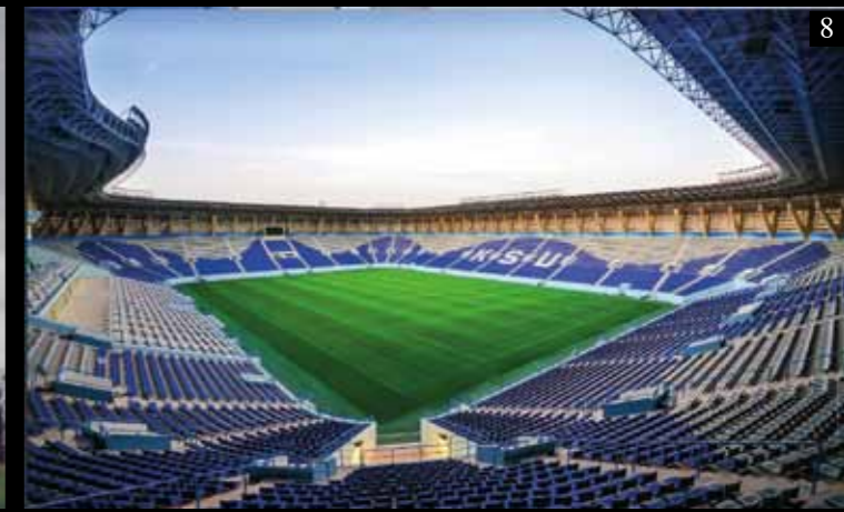
1. Ангар – Дубай - Объединенные Арабские Эмираты. 2. Ангар – Лука - Мальта. 3. Ледовая Арена – Ханты-Мансийск – Российская Федерация 4. Международный Аэропорт – Каир - Египет. 5. Дило ВМ – Торбалы - Турция. 6. Фабрика По Производству Кокосового Масла – Аква-Ибом - Нигерия. 7. Цирковая Арена – Ашхабат - Туркменистан. 8. Стадион Имени Короля Саудовской Аравии – Эр-Рияд – Саудовская Аравия.