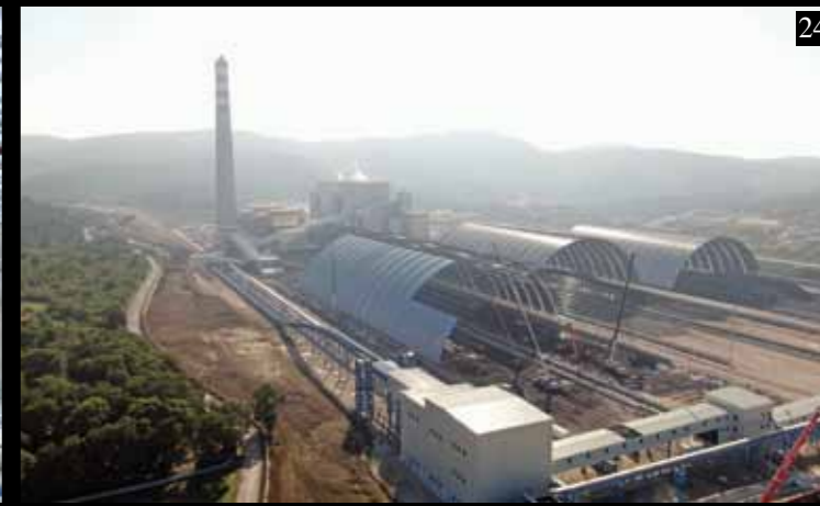
9. Выставочный Комплекс Тюяп – Стамбул - Турция. 10. Ангары Для Парковки TIR – Кербела - Ирак. 11. Цементный Завод ‘Сонмез’ – Адана - Турция. 12. Цементный Завод ‘Джета’ – Чанаккале - Турция. 13. Хранилище Серы ‘Руваис’ – Абу-Даби - О.А.Э. 14. Цементный Завод ‘Лимак Анка’ – Анкара - Турция. 15. Меж. Аэропорт им. Ататюрка Терминал TAV – Стамбул - Турция. 16. Меж. Аэропорт – Тбилиси - Грузия.